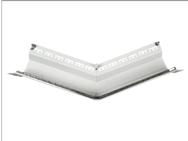
Everon® Copper DataCom, Panneau RJ45, Everon® Datennetzwerktechnik Verteilerfelder, 160° gewinkelt Verteilerfeld 19 Zoll 1HE 24 Ports, Keystone, Weiß, leer