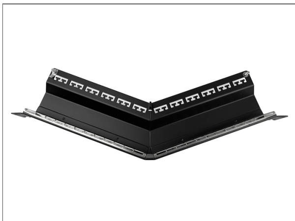
Everon® Copper DataCom, Panneau RJ45, Everon® Datennetzwerktechnik Verteilerfelder, 160° gewinkelt Verteilerfeld 19 Zoll 1U 24 Ports, Keystone, Schwarz, leer