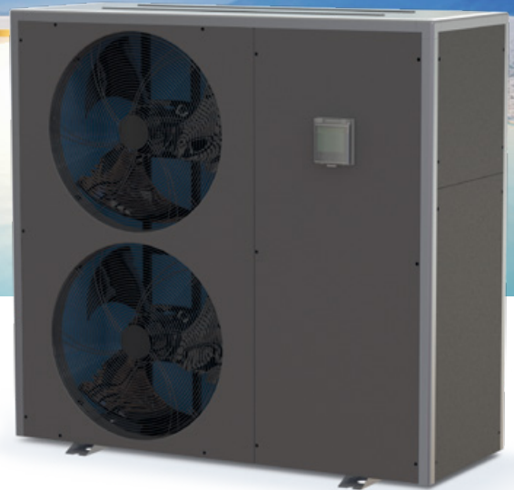
MASTER INVERTER XL Tri

Grâce à son système de régulation intelligente exclusif , la pompe à chaleur réversible Master-Inverter régule sa puissance en fonction de la température de l'eau mais aussi en fonction de la température ambiante afin de toujours assurer la bonne température de baignade, le meilleur COP* et le plus bas niveau sonore !