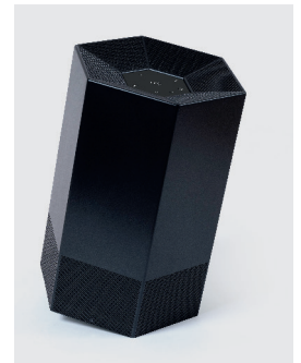
Noir mat RÉF. 8 77 2127-BK