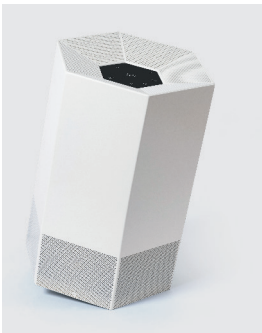
Blanc crème RÉF. 8 77 2127-WH