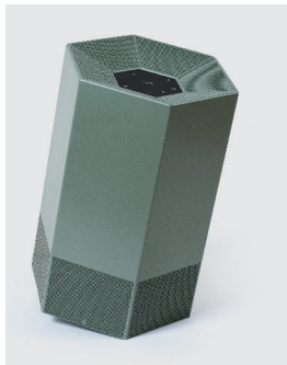
Vert Malachite RÉF. 8 77 2127-GR