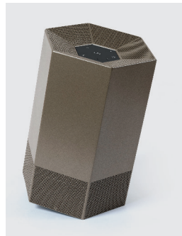
Bronze RÉF. 8 77 2127-BR