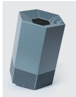
Bleu Saphir RÉF. 8 77 2127-BL