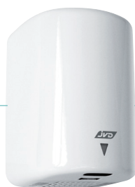
REF 8 11 614 Hurricane automatique blanc UL 1 : 4