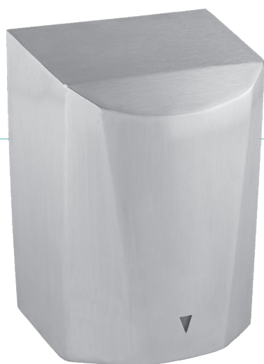
REF 8 11 879 Hurricane automatique inox satiné UL 1 : 4