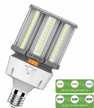
145791 LED Corn Switch E40 54W-80W 7300-11600lm 3000K-5000K