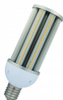
80100036338 LED Corn HOL E40 54W 7300lm 3000K