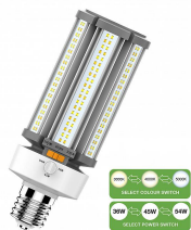
145790 LED Corn Switch E40 36W-54W 4800-7800lm 3000K-5000K