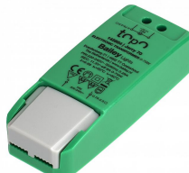
145684 TOPO Jerry Transformateur 12V AC 0-70W / LED 0-45W DIM