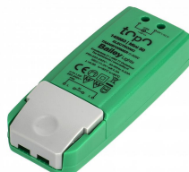
145683 TOPO Mini Transformateur 12V AC 0-50W / LED 0-30W DIM