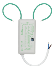
146219 TOPO Little Transformateur 12V AC 0-50W / LED 0-20W DIM