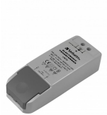
143820 LED Transformateur 12V AC 0-45W DIM LED lampe