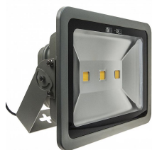
90500032464 LED Projecteur Gris 150W 15960lm 6500K 100V-240V