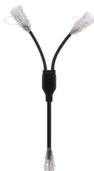
146944 Diviseur 2 sorties (2Y) pour LED Rope Plus