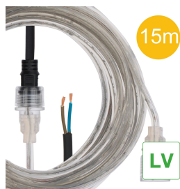
147030 RoBust LED Rope AC42V 15M 4.5W/m 450lm/m 4000K IP65