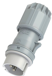
147038 Kerf 082-12v CEE Prise 16A 2p 42V 12h IP44