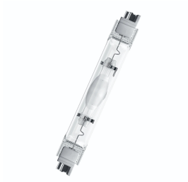
146241 MH-DE Fc2 400W/NDL 4200K