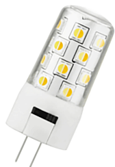
147087 LED G4 DIM 12V 3W (28W) 300lm 930-965 Clair