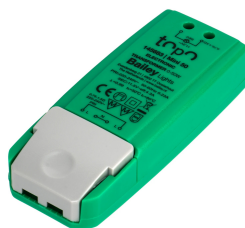
145683 TOPO Mini Transformateur 12V AC 0-50W / LED 0-30W DIM