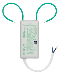
146219 TOPO Little Transformateur 12V AC 0-50W / LED 0-20W DIM