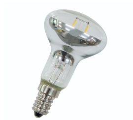
142694 LED FIL R50 E14 DIM 4W (32W) 350lm 827