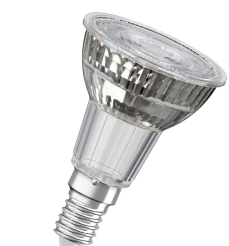
146921 LED PAR16 E14 DIM 4.8W (50W) 350lm 927 36°