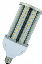
80100036335 LED Corn HOL E27 36W 4860lm 3000K