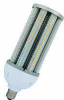
80100036299 LED Corn HOL E27 45W 6080lm 3000K