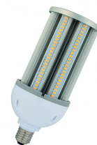
80100036295 LED Corn HOL E27 36W 5100lm 4000K