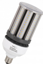
80100040986 LED Corn Basic E27 36W 4000K 100V-240V