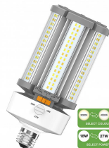
145788 LED Corn Switch E27 18W-36W 2400-5200lm 3000K-5000K