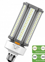
145789 LED Corn Switch E27 36W-54W 4800-7800lm 3000K-5000K