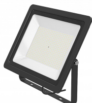
141544 LED Projecteur Slim 150W 12300lm 3000K