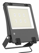
145820 LED Projecteur Switch 100W-150W 12500-21000lm 3000K-6500K