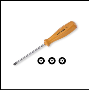
310514 Outil TORX