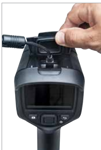
Télécharger des images en un clin d'œil en USB

Les caractéristiques peuvent être modifiées sans préavis. Pour obtenir les caractéristiques les plus à jour, rendez-vous sur www.flir.com