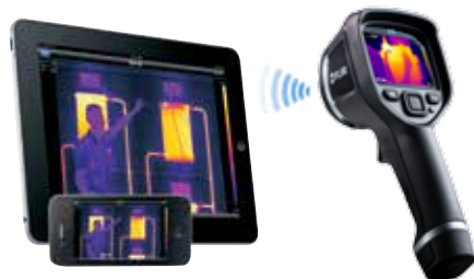
Connectivité sans fil aux smartphones, tablettes et bien d'autres appareils.

*Après enregistrement du produit sur notre site www.flir.com