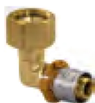
Coude à sertir écrou libre