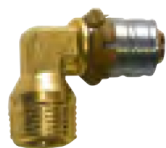
Coude à sertir 90° filetage mâle