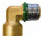
Coude à sertir 90° taraudage femelle