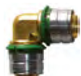
Coude à sertir 90°