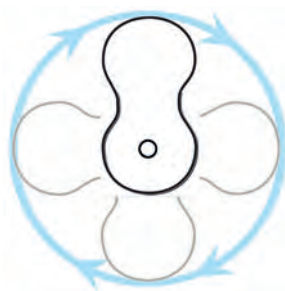
Grille orientable à 360°