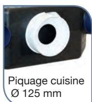
Piquage cuisine Ø 125 mm