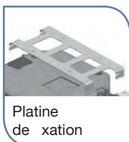
Platine de xation