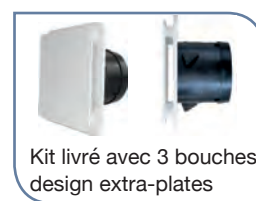
Kit livré avec 3 bouches design extra-plates