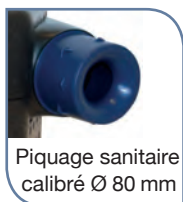
Piquage sanitaire calibré Ø 80 mm