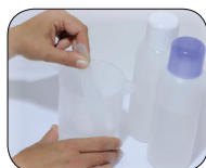
Mélanger pendant 15-30 sec. max.