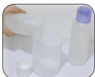
Verser le composant 'A'