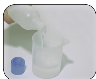
Verser le composant 'B'