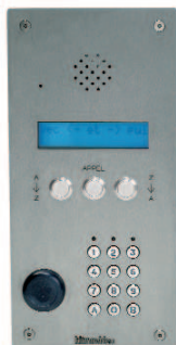
Platine UAV0154/I10 (avec clavier)