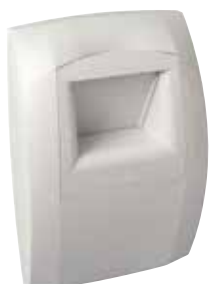
Bahia Curve cuisine

La bouche BAHIA CURVE L permet de garantir l'extraction suffisante et permanente des pollutions intérieures en fonction du taux d'humidité dans la pièce.