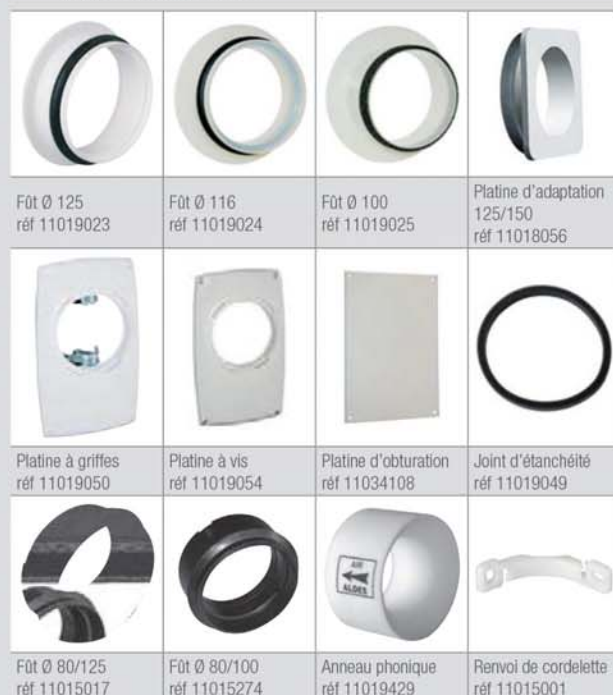
Fût Ø 125 réf 11019023