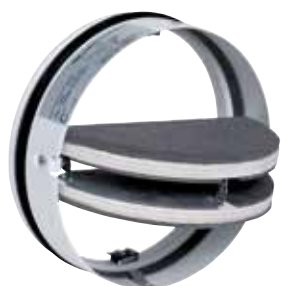
Cartouche coupe-feu CF1/ CF2