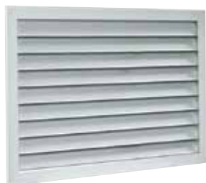
AG 638 200x200 F1

La grille extérieure murale AG 638 permet la prise d'air neuf ou le rejet d'air vicié sans risque d'entrée de pluie grâce à la forme de ses ailettes.