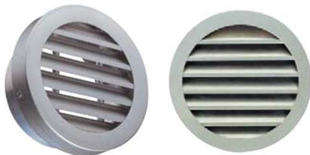
Grille AR 637 jusqu'à Ø 315 mm