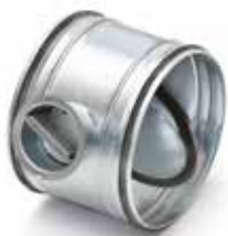
RGE à joint manuel