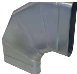
Coude Horizontal Oblong 90°