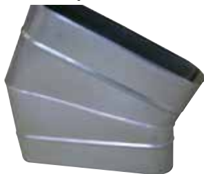
Coude Horizontal Oblong 30°