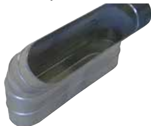
Coude Vertical Oblong 45°