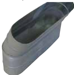
Coude Vertical Oblong 30°