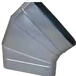
Coude Horizontal Oblong 45°