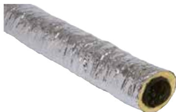
Algaine isolée épaisseur 25 mm

Gamme de conduits souples plastiques isolés par 25 mm de fibre de verre pour réseaux de ventilation en volume non chauffé d'une maison individuelle.