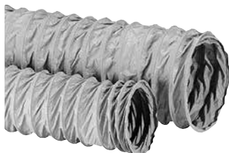
Algaine standard armée fibre

Gamme de conduits souples plastiques renforcées pour réseaux de ventilation en maison individuelle.