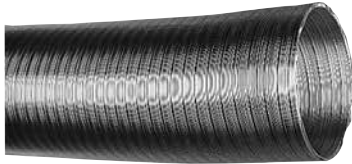
Aiflex Alu compacté