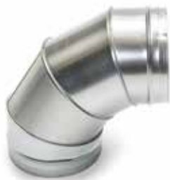
Coude 90° secteur

Le coude 90° permet de changer la direction d'un réseau galvanisé de 90°.