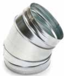
Coude 45° secteur

Le coude 45° permet de changer la direction d'un réseau galvanisé de 45°.