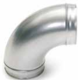
Coude 90° embouti

Le coude 90° permet de changer la direction d'un réseau galvanisé de 90°.