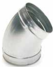
Coude 45° embouti