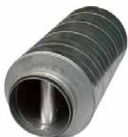
Octa à baffle diamètre 630 à joint

Le piège à son OCTA à Baffle atténue très fortement la propagation acoustique (moyennes et hautes fréquences) dans un réseau circulaire.