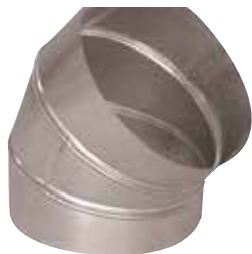
Coude 45° en aluminium