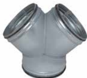
Culotte Simple 90° à joints