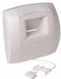
BOUCHE BW31 BAHIA sans fût cordelette

La bouche BAHIA CURVE S est une bouche hygroréglable à destination des sanitaires (Salle de bain et WC) permettant de garantir l'extraction suffisante et permanente des pollutions intérieures en fonction du taux d'humidité dans la pièce.