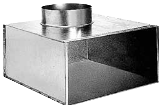
Plénum arrière RT