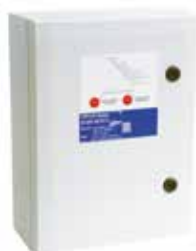
Coffret AXONE-2V/DES-DAH 25.4A

AXONE Micro III 2V/DES est un coffret de relayage précâblé et certifié NF permettant de piloter des ventilateurs de désenfumage.