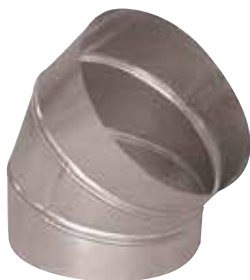
Coude 45° en aluminium

Le coude 45° alu permet de changer la direction d'un réseau aluminium de 45°.