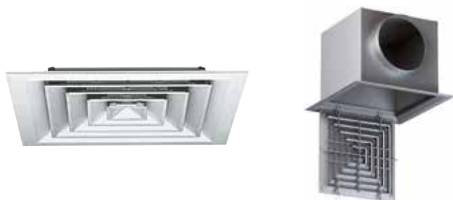
Diffuseur A 704

Le AF 704 TP est un diffuseur carré pour dalle de plafond avec 4 directions de soufflage pour la diffusion d'air dans les locaux tertiaires.