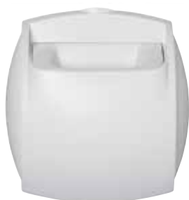
Bap'SI simple débit sanitaire

La bouche BAP'SI Simple Débit Sanitaire, idéale pour les logements neufs, elle permet de garantir un débit d'air constant quelles que soient les conditions dans le logement.