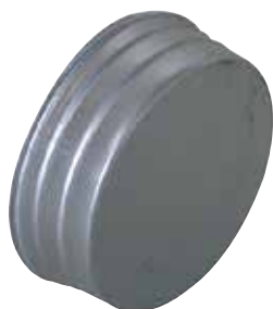
Bouchon Mâle Femelle en aluminium

Le bouchon mâle femelle alu permet de boucher un conduit ou un accessoire en aluminium dans les locaux tertiaires et les logements collectifs.